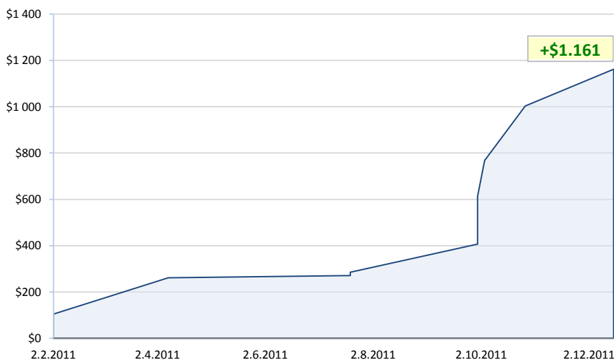
ETF forex - rok 2011 (bez poplatků, uzavřené pozice)