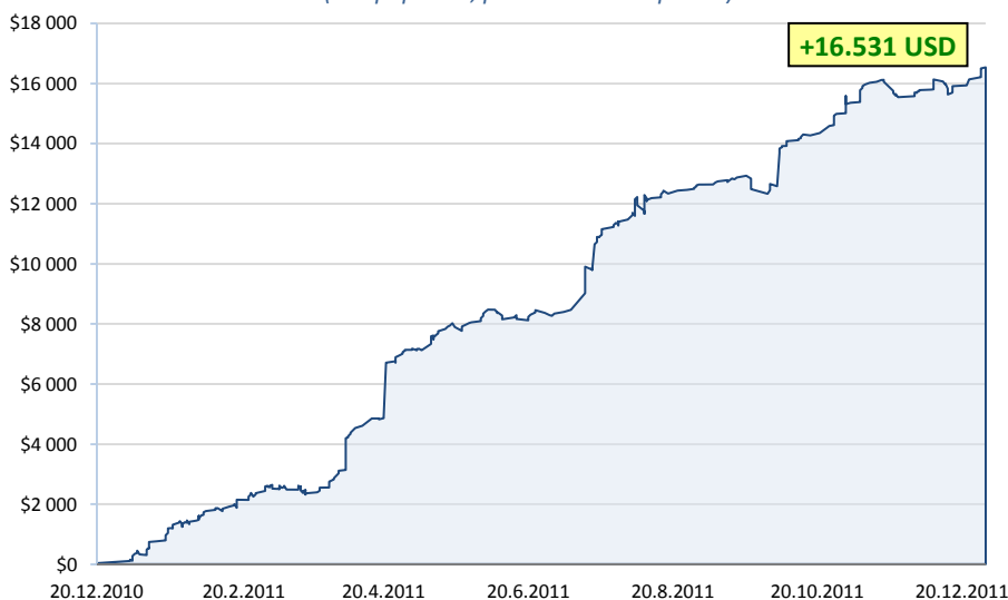
všechna portfolia - rok 2011 (bez poplatků, pouze uzavřené pozice)