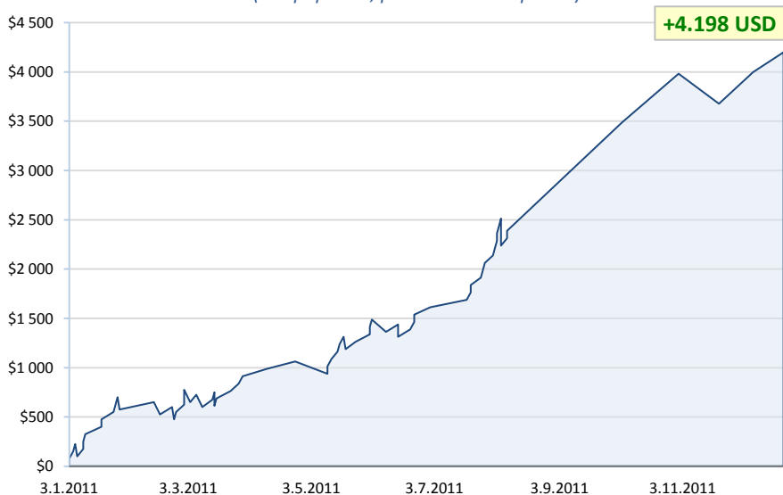
S&P500 - rok 2011 (bez poplatků, pouze uzavřené pozice)